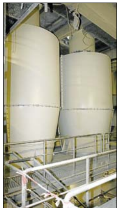
Die beiden Zyklofen nehmen das fertig bearbeitete Material auf.