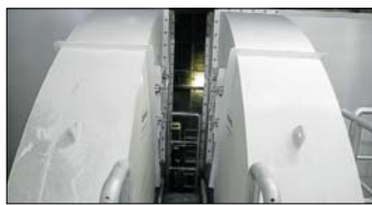
Nach der Verarbeitung im Sichter wird das Metrial in die Zyklofen überführt.