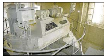
Ausgedient haben die 40 Jahre alten Sichter, die demnächst demontiert werden.